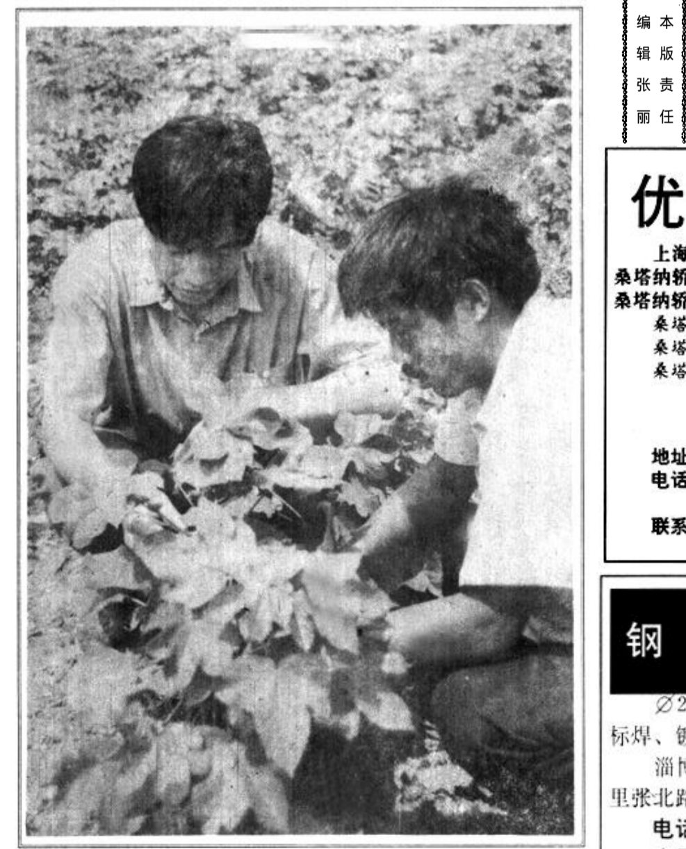
△ 东营区庄庄镇种棉的1000亩大铃棉长势良好。大铃棉是棉花的一个新品种，以其铃大、高产、抗虫力强为特点。该镇今年先试种1000亩，一旦成功，将大面积推广。

他们的做法是：(一)抓整顿，促提高。总公司领导针对近年物资企业暴露的一些深层次问题和矛盾，加大整顿力度，先后对7个企业的班子进行了调整，对过去长期以来的企业“三不管”人员逐一进行处理，对8个规模较小、业务重叠的公司进行了合并，对扭亏无望的特困企业依法纳入破产试点。同时，对经济违纪案件从严进行了查处。(二)抓管理，增效益。一是狠抓各公司一把手的管理，通过实行任期目标责任制，调动经理的工作责任感。二是突出财务管理，通过审计，查遗漏，堵漏洞，有效地提高了企